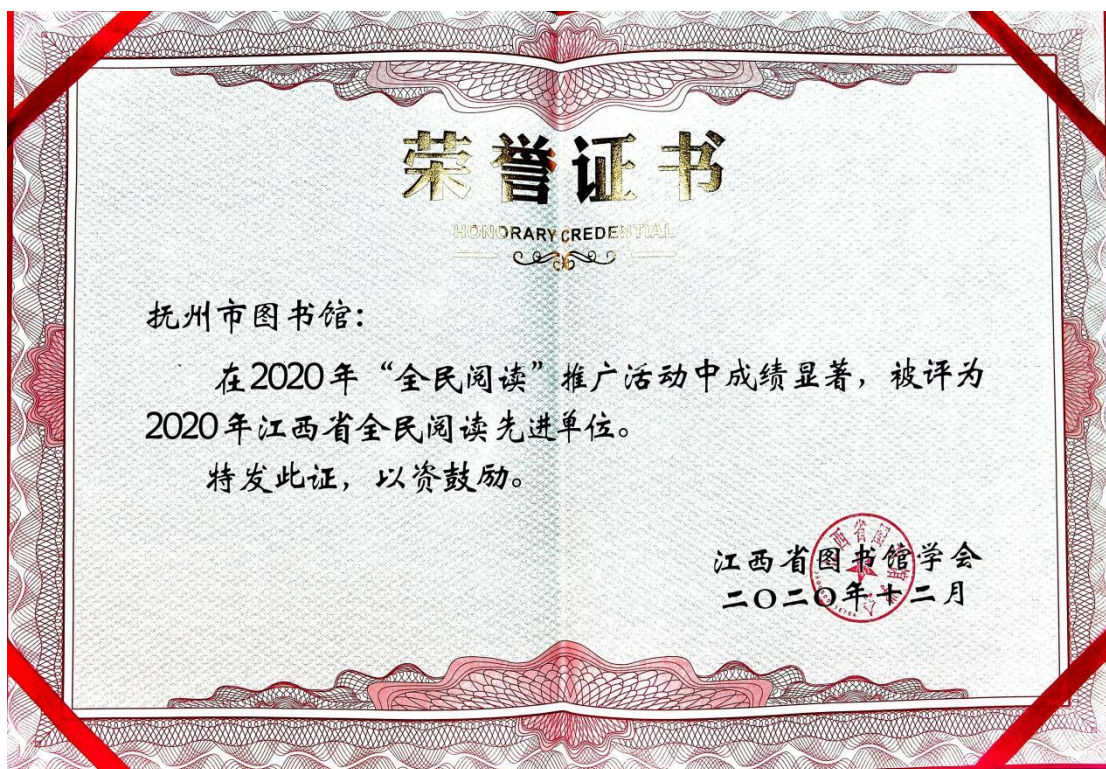
2020年江西省全民阅读先进单位