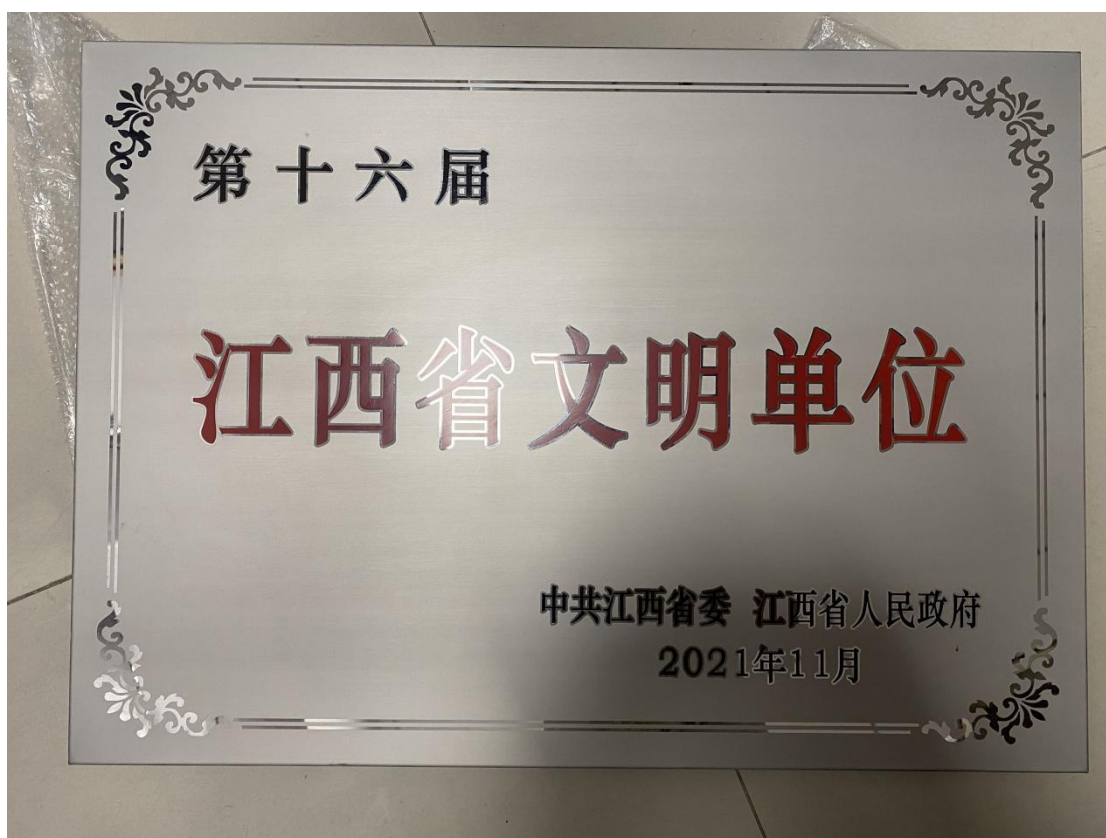
第十六届江西省文明单位